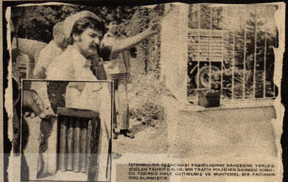
İSTANBUL'DA ECZACIBAŞI FABRİKASININ BAHÇESİNE YERLEŞTİRİLEN TAHRİP KALIBI. BİR TRAFİK POLİSİNİN GÖRME SONUCU TESİRSİZ HALE GETİRİLMİŞ VE MUHTEMEL BİR FACIANNIN ÖNÜ ALINMIŞTIR.

tır. Peki, bu sabotajlar bugün en çok kimin işine yaramaktadır? Brejnev revizyonistleri, ekonomisi çökmüş ve kendisine muhtaç hale gelmiş bir Türkiye istiyor. Onlar direnme gücü zayıflamış bir Türkiye'nin kendileri için kolay yutulacak lokma olduğunu düşünüyorlar. MC'nin borazanlığını yapan