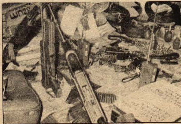
Milliyet, 23 Ağustos 1977